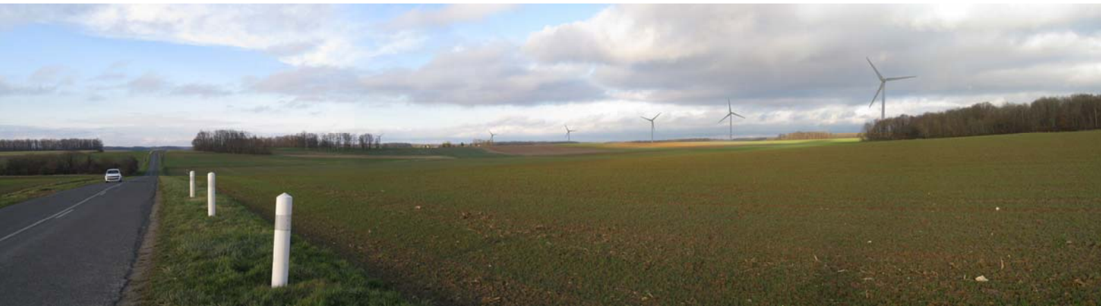
Photomontage de 6 éoliennes de 150m de haut en bout de pales, vue de l'entrée sud du village (Logiciel windpro© agrée et focale 50mm : vision humaine et échelle respectée)