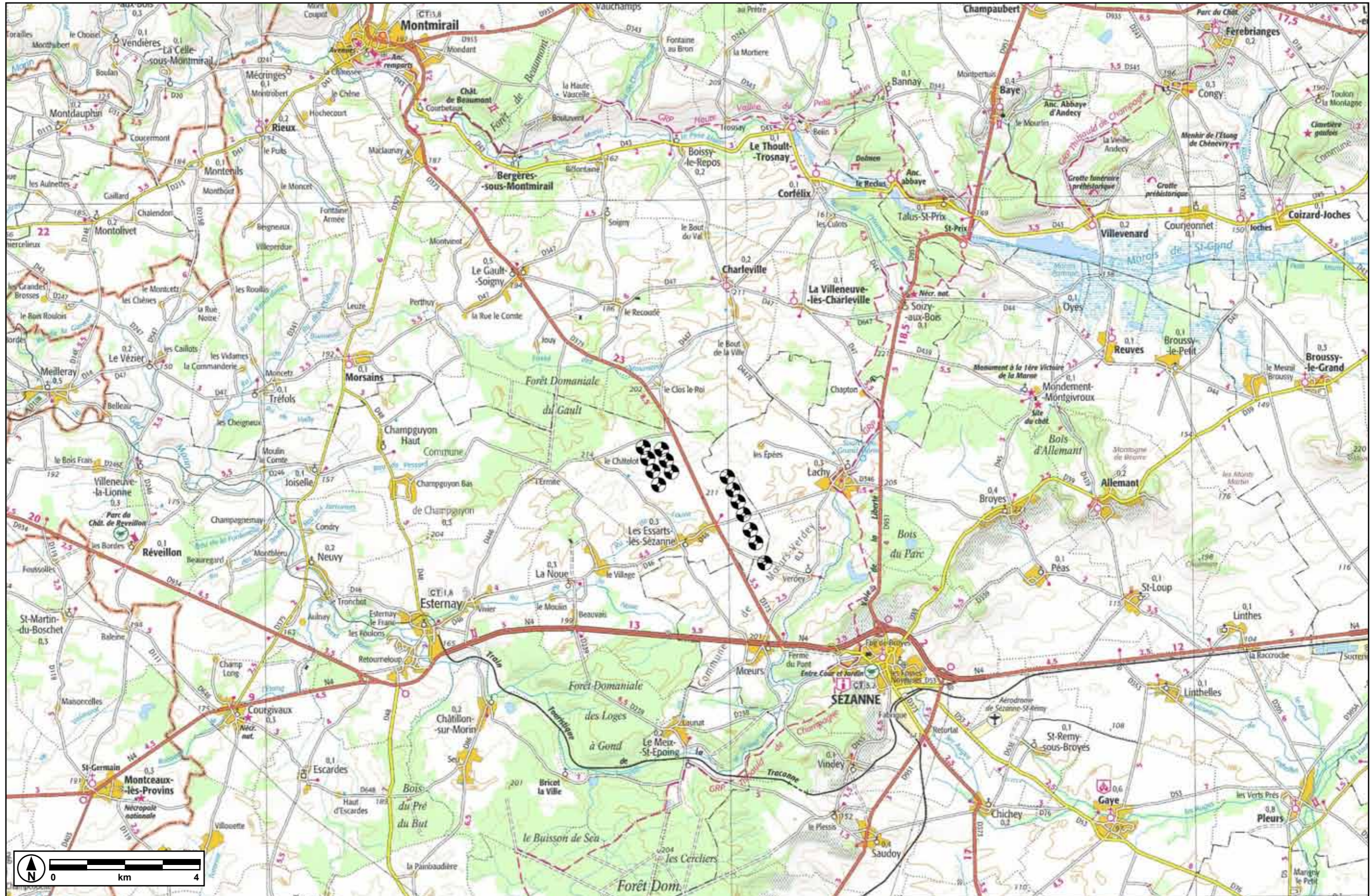
Figure 1: Carte de localisation du projet au 1/100.000ème